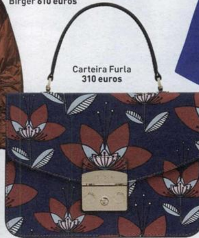
Carteira Furla 310 euros