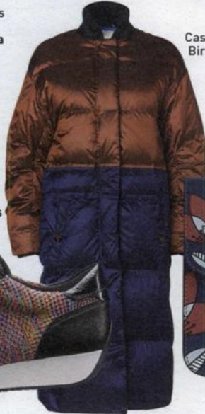
Casaco by Malene Birger 610 euros