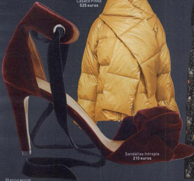
Casaco Pinko 535 euros