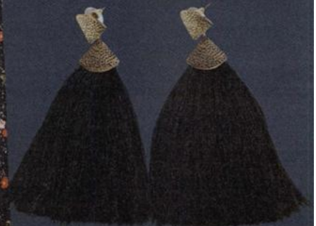
Brincos Parfois 6,99 euros