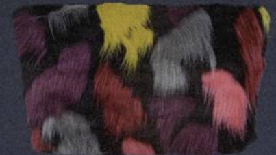
Carteira Tous, preço sob consulta