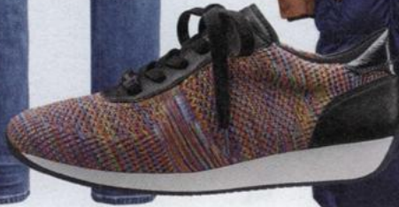
Tênis Ara 119,50 euros