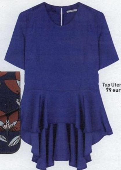
Top Uterqüe 79 euros